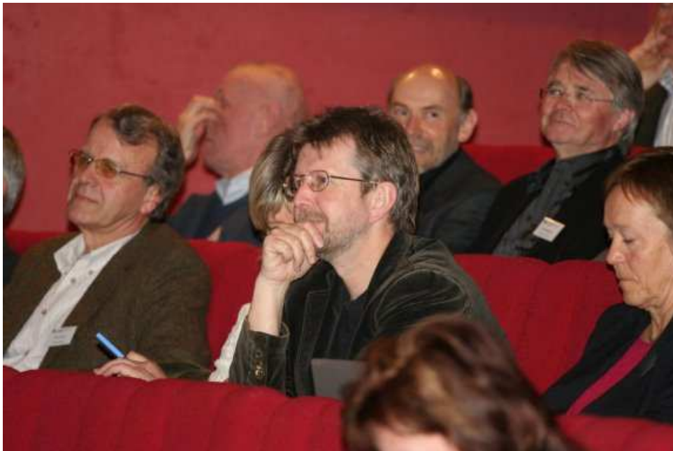
Rundt 160 deltakere fant veien til årets Universitetskonferanse