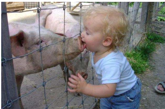
Svineinfluenzaen er kommet!