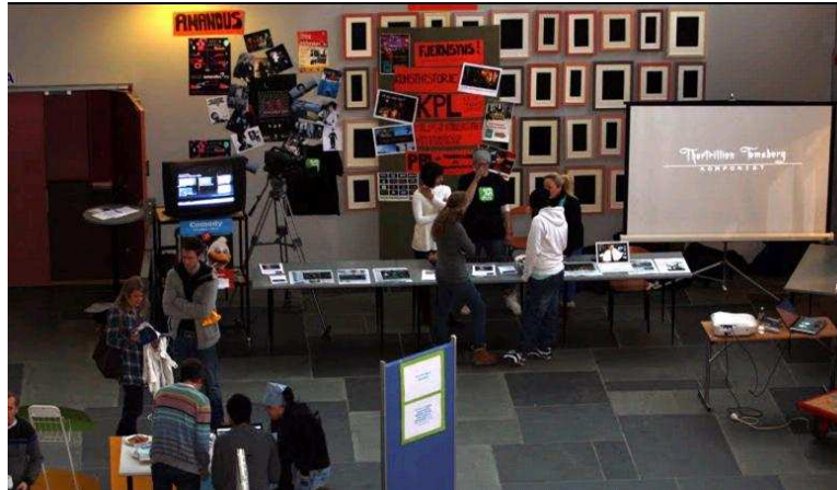
Åpen dag for videregående skoler ble arrangert onsdag 4. november 2009. Ca 600 elever deltok